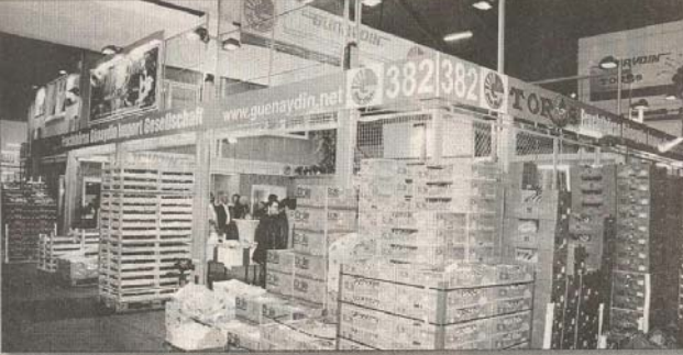
Şimdiye kadar 600 metrekarelik alanda hizmet veren Günaydın Group, 30. yılında 1000 metrekarelik büyük bir stand taşındı.