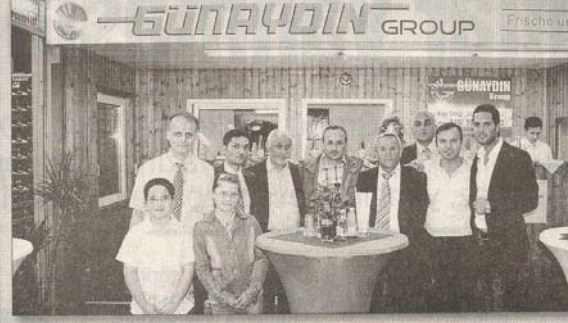
30. yıl kutlaması ve yeni yere taşınmanın onuruna verilen kutlamaya yolda esnaf da katılarak hayırlı olsun temennisinde bulundu.