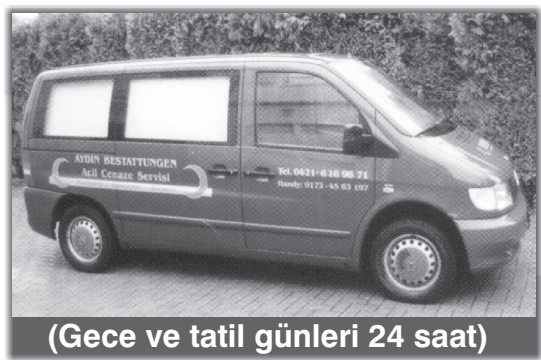
(Gece ve tatil günleri 24 saat)